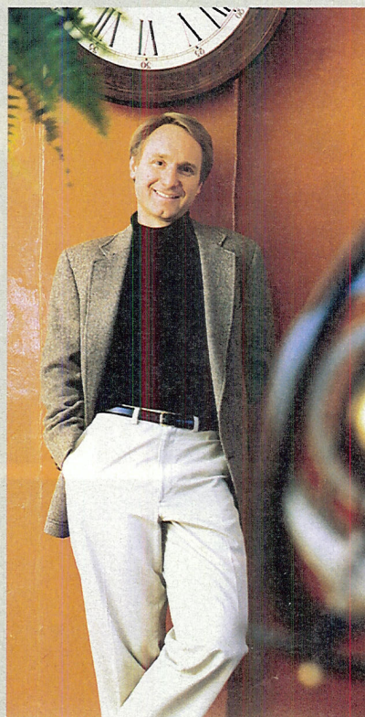
Dan Brown, el autor de "El código Da Vinci"

En su "Código Da Vinci", Brown se ha inspirado en una serie de autores que en los últimos veinticinco años han