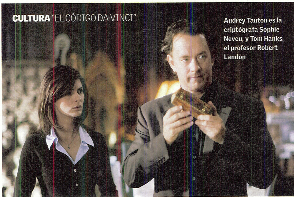
Audrey Tautou es la criptógrafa Sophie Neveu, y Tom Hanks, el profesor Robert Landon