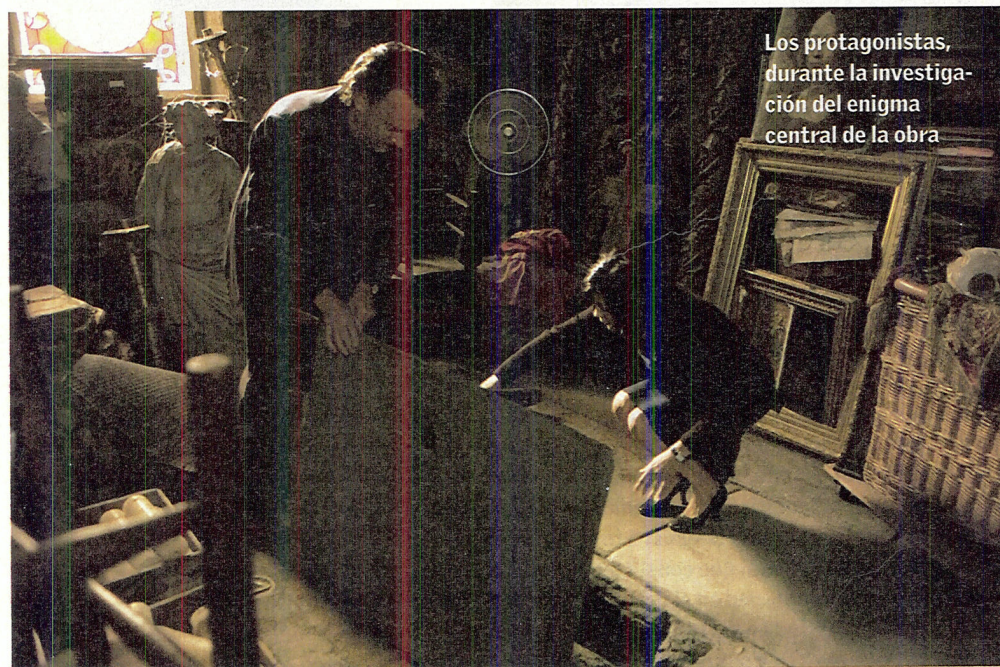
Los protagonistas, durante la investigación del enigma central de la obra